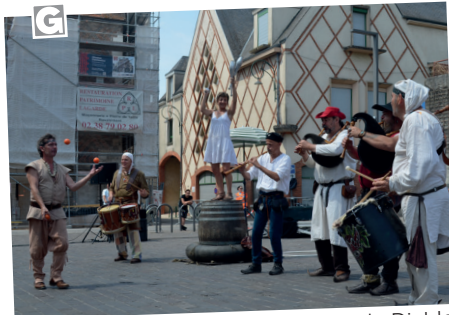
■ 9 juillet - compagnie Les Percus du Diable.