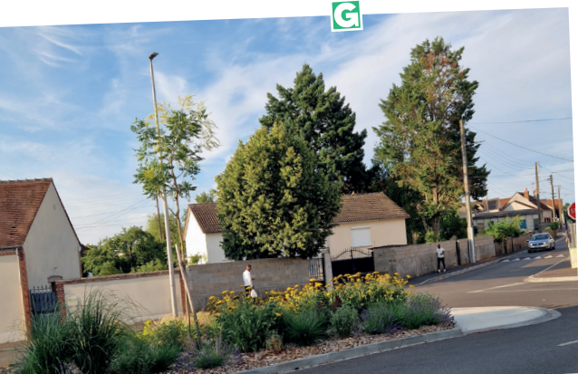
■ Koelreuteria Paniculata (savonnier).