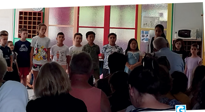
■ 23 juin - école élémentaire du Berry.

Mail : ec-berry-gien@ac-orleans-tours.fr