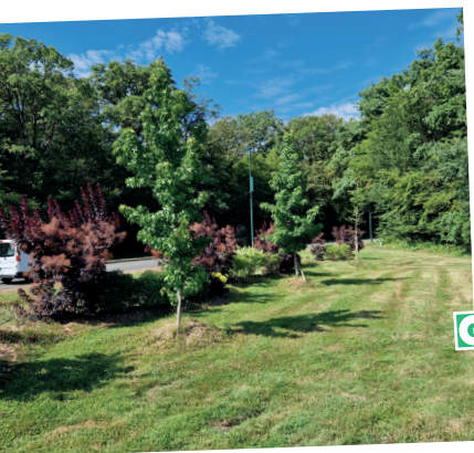
■ Arrabloy : 2 Liquidambers et 1 Quercus Palustris (chêne des marais)