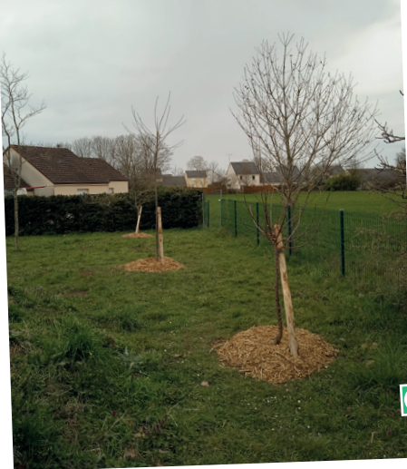
■ Parc Chopin : 3 Prunus Armeniaca (abricotier), 2 Prunus Avium (cerisier) et 2 Prunus Persicas (pêcher)