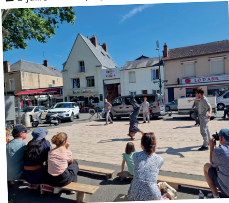
■ 8 juillet - compagnie Bakhus.