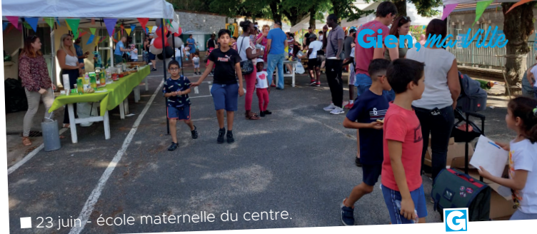
■ 23 juin - école maternelle du centre.