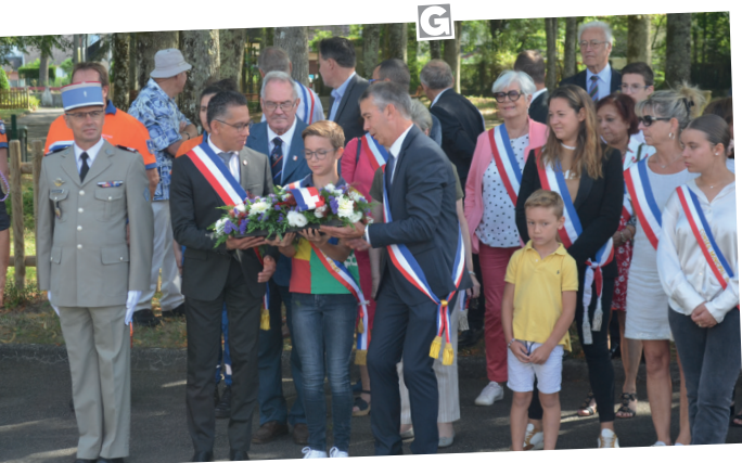
■ 14 juillet - les festivités ont débuté par le dépôt d'une gerbe à Arrabloy.