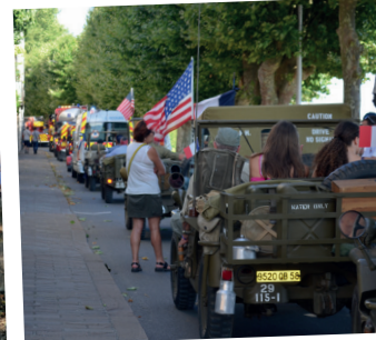
■ Parti de la place Foch, le défilé arrivait au Port au bois.