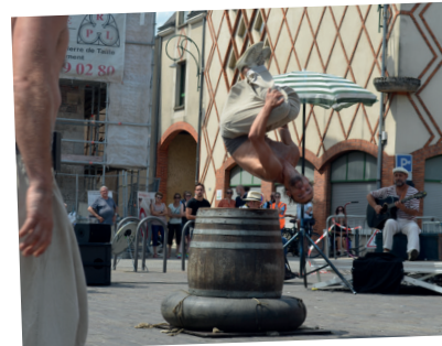
■ 9 juillet - compagnie Bakhus.