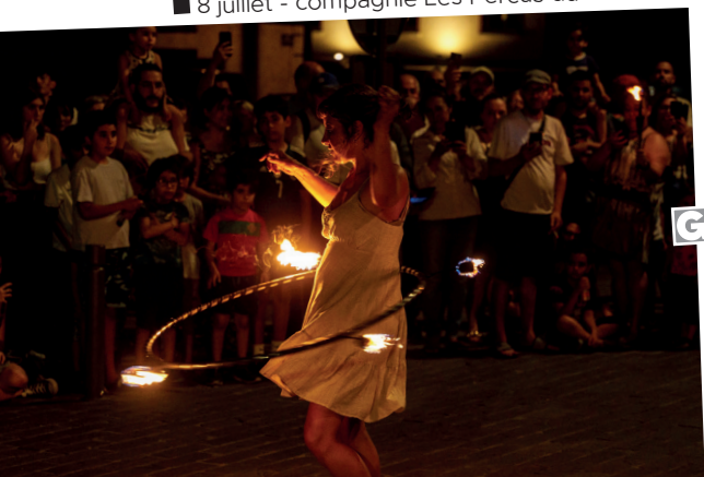
■ 8 juillet - compagnie Les Percus du Diable.