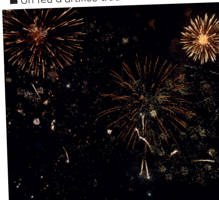
■ Un feu d'artifice traditionnel et innovant.