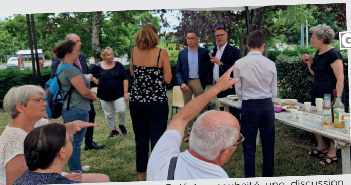
■ 12 juillet - M. le Sous-Préfet a souhaité une discussion informelle avec des Giennois.

48 questionnaires ont été recueillis par les adultes relais dans les quartiers et un déjeuner d'échanges a eu lieu entre les habitants, les représentants de l'État et des élus.