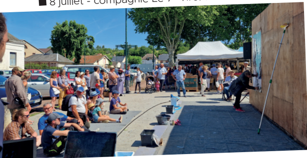
■ 8 juillet - compagnie Le 7 e Tiror.