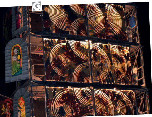
■ 7 juillet - compagnie Lucamoros.